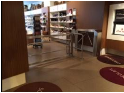
Abb. 14: Durchgang zum Shop