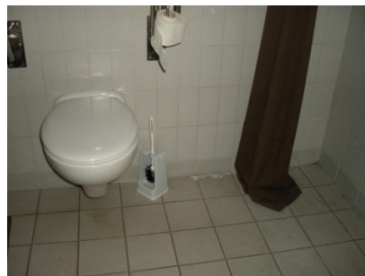
Abb. 20: WC