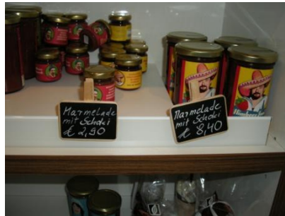
Abb. 18: Shop