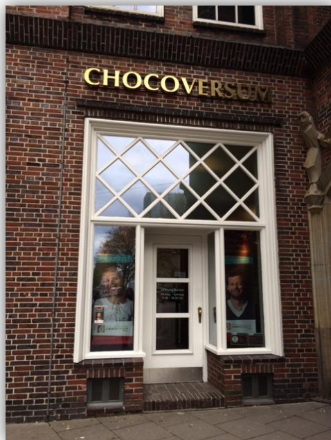
Abbildung 1: Außenansicht