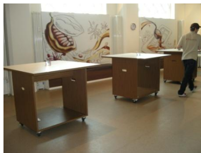
Abb. 12: Aromaatelier