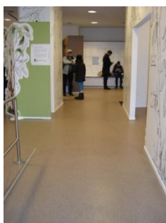
Abb. 6: Eingangsbereich