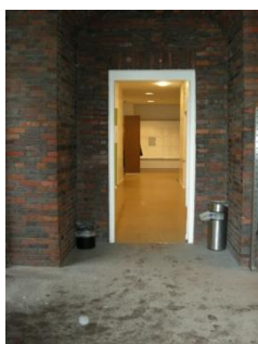
Abb. 5: Nebeneingang