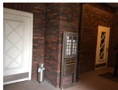
Abb. 4: Nebeneingang