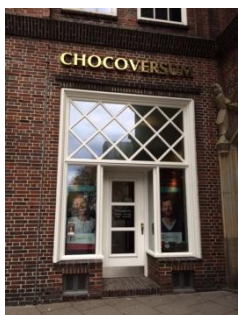
Abb. 2: Eingangsbereich