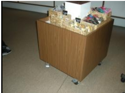
Abb. 17: Shop