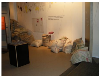
Abb. 9: Ausstellungsraum