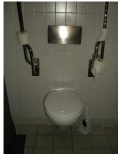
Abb. 21: WC