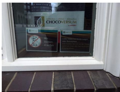
Abb.3: Hinweise außen