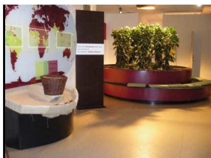
Abb. 8: Ausstellungsraum