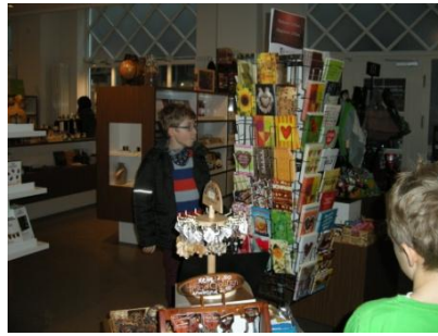
Abb. 15: Shop