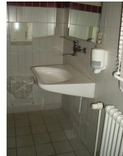
Abb. 22: WC