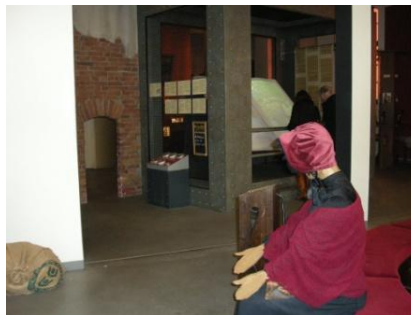
Abb. 6: Ausstellungsraum