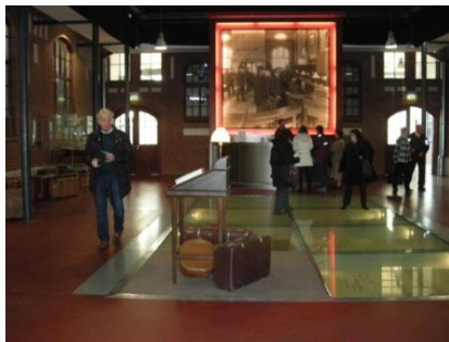
Abb. 5: Ausstellungsraum