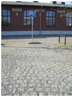
Abb. 2: Parkplatz