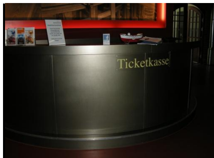
Abb. 6: Ticketkasse