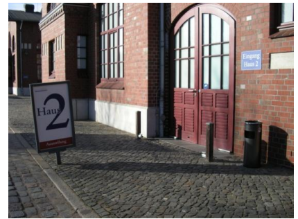
Abb. 4: Weg zu den Häusern