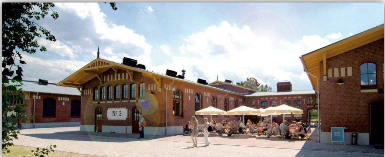
Abbildung 1: Hauptansicht BallinStadt Auswanderermuseum