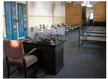
Abb. 7: Ausstellungsraum