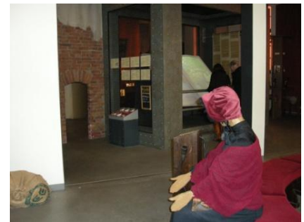
Abb. 7: Ausstellungsraum