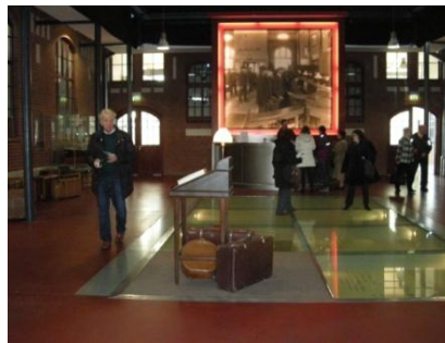
Abb. 6: Ausstellungsraum