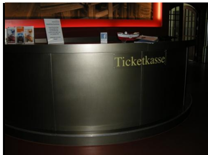
Abb. 5: Ticketkasse