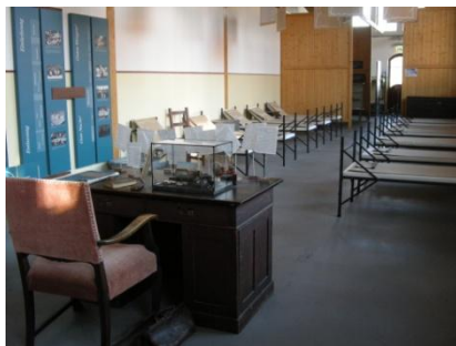
Abb. 8: Ausstellungsraum